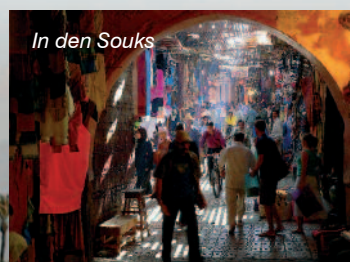
In den Souks