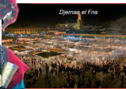
Djemaa el Fna