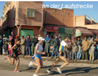
an der Laufstrecke

Er gilt als „Grünster Marathon“ des Orients und wird mit französischer Unterstützung bereits zum 31. mal (mit einem Halbmarathon) organisiert. Marrakeschs Altstadt mit seiner uralten Stadtmauer wird umrundet, ehe es in die Palmenplantagen, Olivenhaine und königlichen Gärten geht. Die Lauftemperatur beträgt ca. 14 - 18 °C. Die Stadt mitten in Marokko bietet wohl nicht nur den reizvollsten Lauf Nordafrikas, sondern auch ein orientalisches Flair, das man nur hier in dieser Art und Weise findet – mit einem Markt der Gaukler, Schlangenbeschwörer, Händler und Zauberer. Man muss einmal Marrakesch gesehen und an seinen Laufstrecken teilgenommen haben.