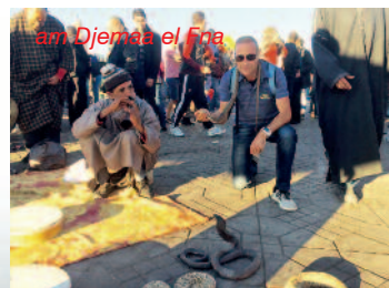
am Djemâa el Fna