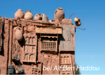
bei Ait Ben Haddou