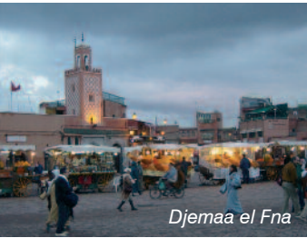
Djemma el Fna